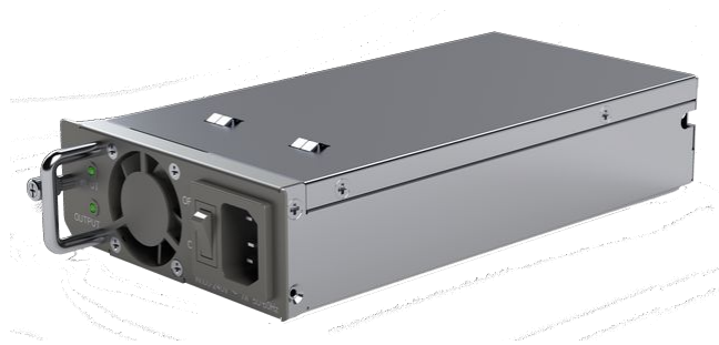
Таблица 2. Блоки питания коммутаторов N3000